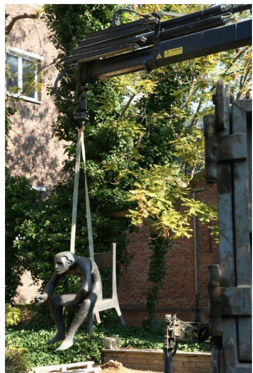
Boontje in de takels...