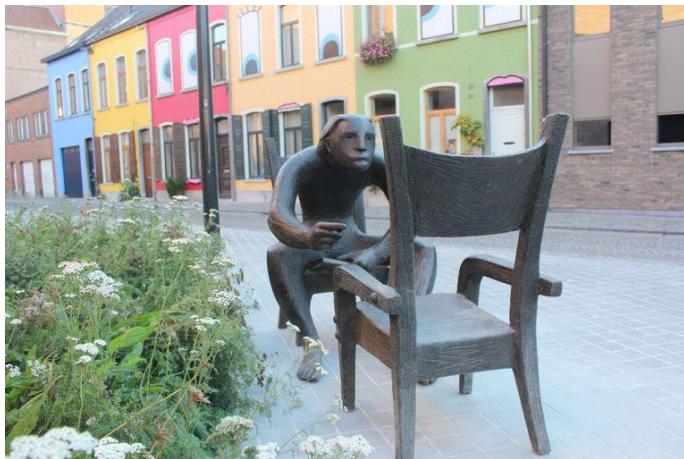
De Verteller op zijn nieuwe stek – het pleintje voor Utopia