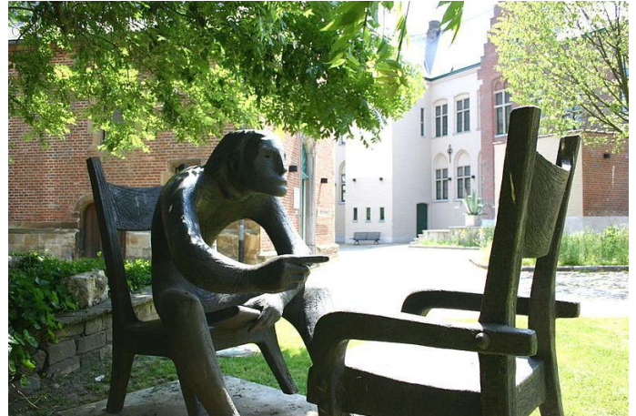
Standbeeld 'De Verteller' op de binnenkoer van het Stedelijk Museum 't Gasthuys in Aalst