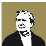
LOUIS PAUL BOON GENOOTSCHAP