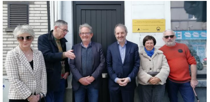
Vertegenwoordiging van het Boongenootschap voor de nieuwe gedenkplaat aan het geboortehuis van Boon