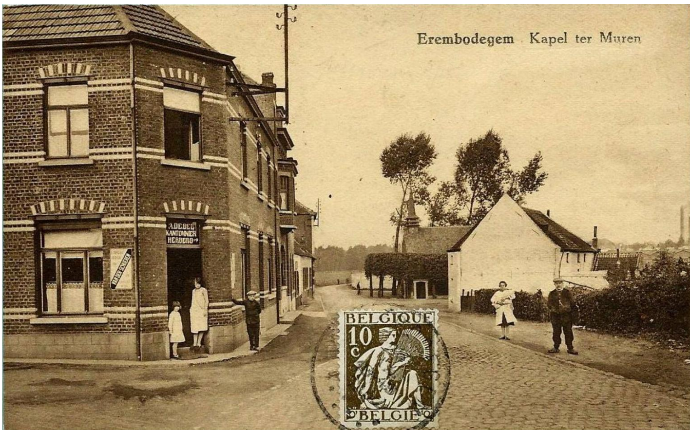
Historische ansichtkaart van de Kapellekensbaan