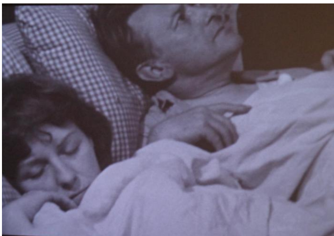
Beeld uit de film: Louis Paul Boon en Betsy Blair